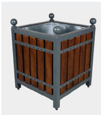
Réf. C0084 réserve d'eau